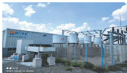
江苏硕赢新能源科技有限公司 10KV 车间新建项目