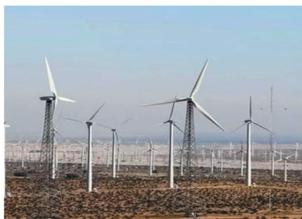
兴安盟突泉县445MW风电项目