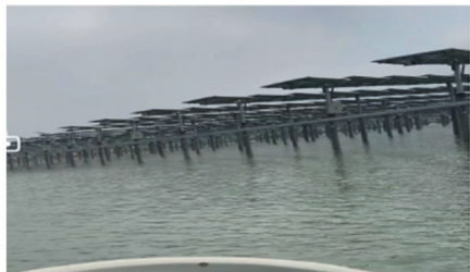
上海电气湖南岳阳水上扶贫光伏项目