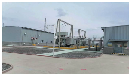
镇江新纳材料35KV变电所新建项目