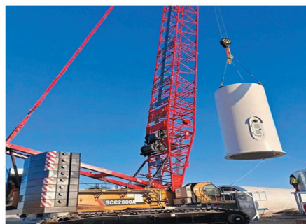
巴州白鹳洲31.5兆瓦分散式接入风电项目

21:21 | 2022-07-28 星期四 多云 33°C 库尔勒市·库尔勒市 项目名称: 巴州白鹳洲31.5兆瓦分散式接入风电项目