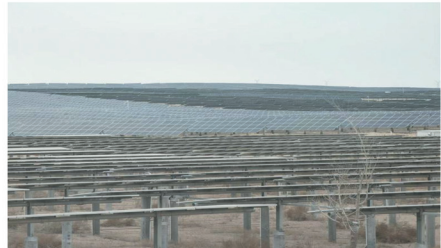
中绿发新疆达坂城项目