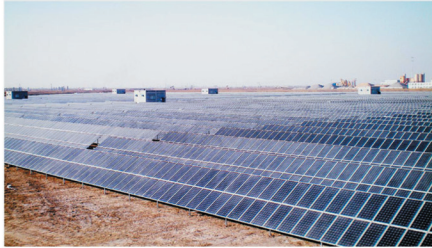
黄河水电青海共和三塔拉光伏发电项目