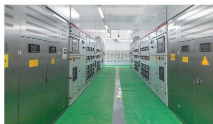
保利泰克电力电缆及配电柜安装项目