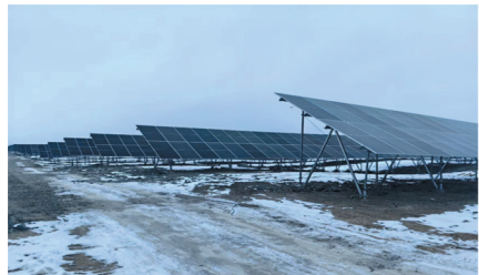
华电新疆达坂城项目