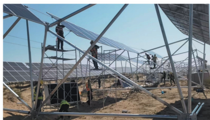
国家能源宁夏宁东柔形支架光伏项目