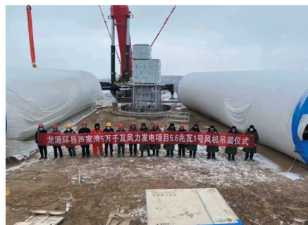
龙源环县芦家湾59MW风电项目工程

第三段塔筒吊装 施工记录 天气: 晴 西北风2级 湿度31% 经度: 76.574070 纬度: 36.492493 地址: 龙源环县芦家湾59MW(核准)风电项目 工程名称: 龙源环县芦家湾59MW风电项目工程 时间: 2022-08-18 09:18:14