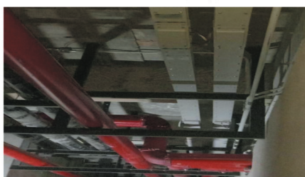
海南清水湾旅游滨海度假区母线安装项目