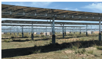
国电建湖北工程青海项目