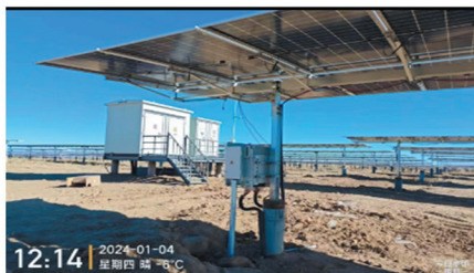
三峡青豫直流二期项目