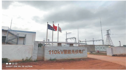
湛江聚能雷州光伏项目