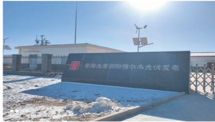
青海大唐国际格尔木光伏发电项目