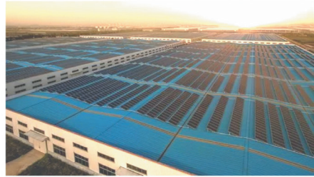
安徽德力日用玻璃有限公司屋顶 分布式光伏发电项目