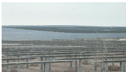
青海省共和塔拉滩光伏项目